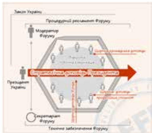
Схема 2. Схема діяльності Стратегічного Форуму

державної частини Музейного фонду України; незривеність державно-приватного партнерства у сфері охорони культурної спадщини, у тому числі нематеріальної» [3].