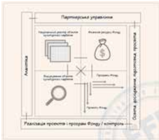
Схема 3. Зміст діяльності Національного фонду культурного надбання